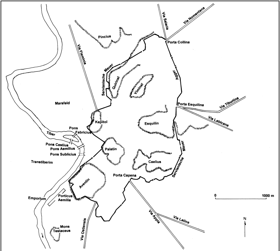
Das Areal der Stadt in den Grenzen der nach 387 v. Chr. errichteten Servianischen Mauer

ans Tageslicht gekommen. Erst verhältnismäßig spät, nach der schriftlichen Überlieferung im Jahre 509/8, ist der Tempel der höchsten Staatsgötter, der sogenannten capitolinischen Trias Iuppiter, Iuno und Minerva, auf dem Burgberg, dem Capitol, erbaut worden. Als Ergebnis der archäologischen Erforschung des frühen Roms bleibt also festzuhalten: Die Monumentalisierung der öffentlichen Funktionen des Staatskultes und der politischen Herrschaftsausübung, die ihren Anfang auf dem Forum Romanum und auf dem Forum Boarium am Tiber nahm, gehören in die Zeit des späten siebten und frühen sechsten Jahrhunderts. Dieser Befund erlaubt die Schlußfolgerung, daß der Akt der politischen Stadtgründung in das letzte Viertel des siebten