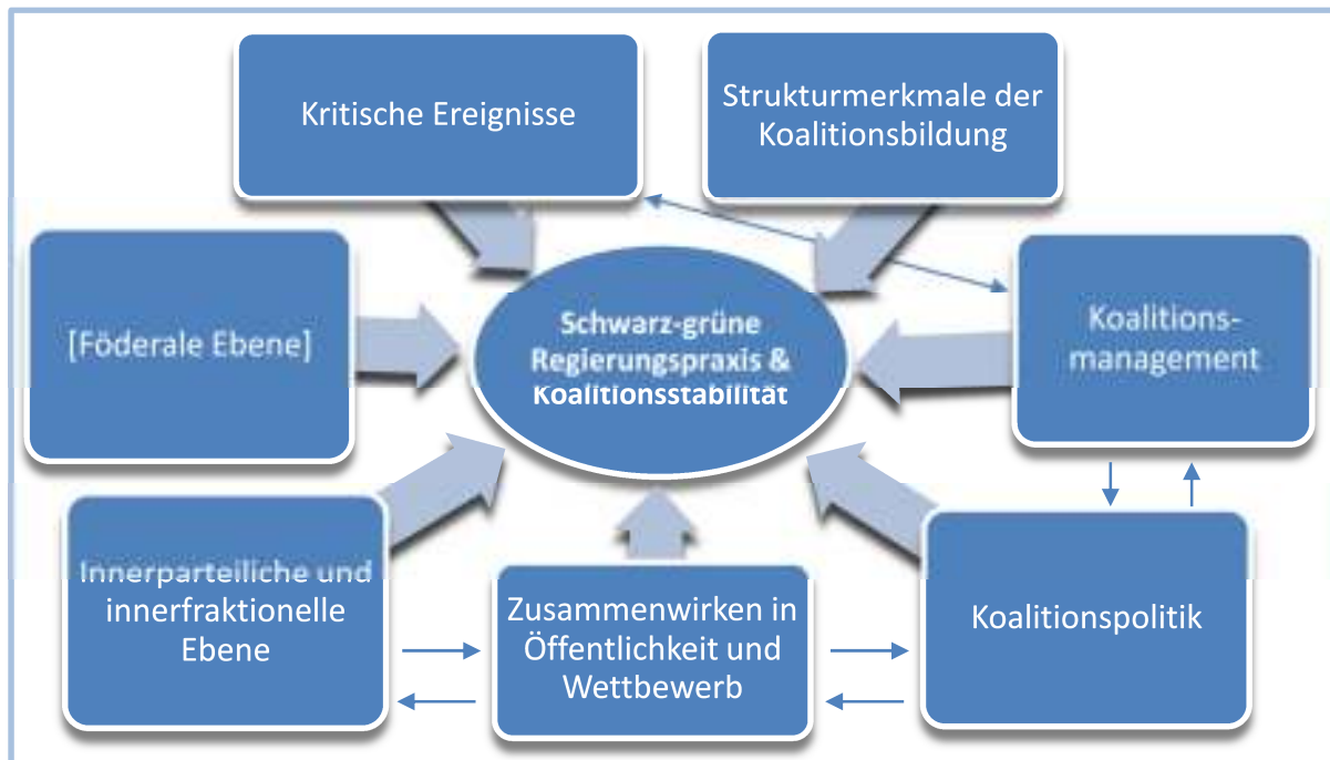
Abbildung 2: Vereinfachtes Schema des multidimensionalen Analyserasters zur schwarz-grünen Regierungspraxis und Koalitionsstabilität

mosphäre in der Koalition können in diesem Rahmen als Gegenstand der Betrachtung gesehen werden.