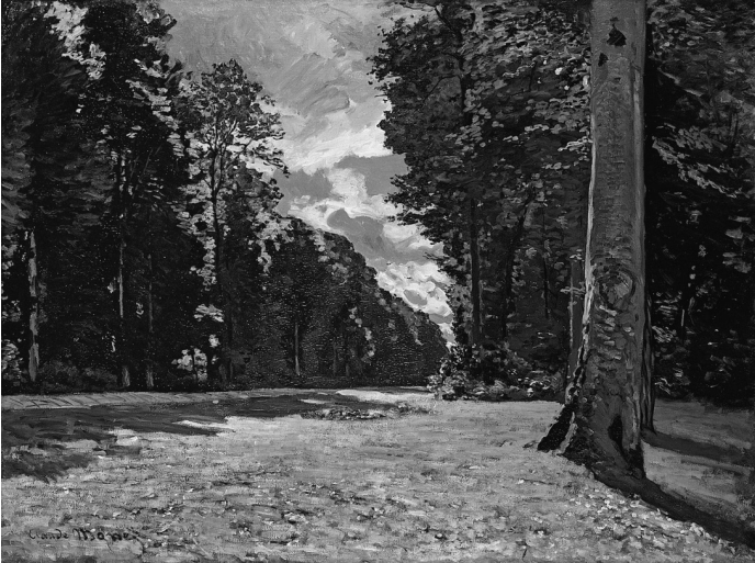
3 Claude Monet: Die Straße von Chailly durch den Wald von Fontainebleau, 1865, Musée d'Orsay, Paris

gen Künstler eine Vielzahl reizvoller Motive bot. Erleichtert wurde die Freilichtmalerei durch die Erfindung der Farbtube. Das zeitaufwendige Anmischen der Ölfarben mit Pigment war nun nicht mehr notwendig. Anders als die Maler von Barbizon waren die Impressionisten nicht an der Darstellung unberührter Naturszenen interessiert. Häufig suchte Monet genau jene Stellen auf, die in Reiseführern besondere Erwähnung fanden und dadurch eine gewisse Bekanntheit besaßen. Mehr noch als auf die detailgetreue Darstellung der Topographie achtete er auf die differenzierte Darstellung des Lichts, das in seiner Lebendigkeit über die Ergebnisse der Maler von Barbizon hinausweist. In Straße von Chailly (Abb. 3) etwa gibt Monet in großem Format und leuchtenden Farben den Weg durch den Wald von Fontainebleau wieder. Die dunklen Bäume kontrastieren mit dem hellen Himmel und dem von der Sonne beschienenen Gras. Monet konzentrierte sich auf das dramatische Lichtspiel und