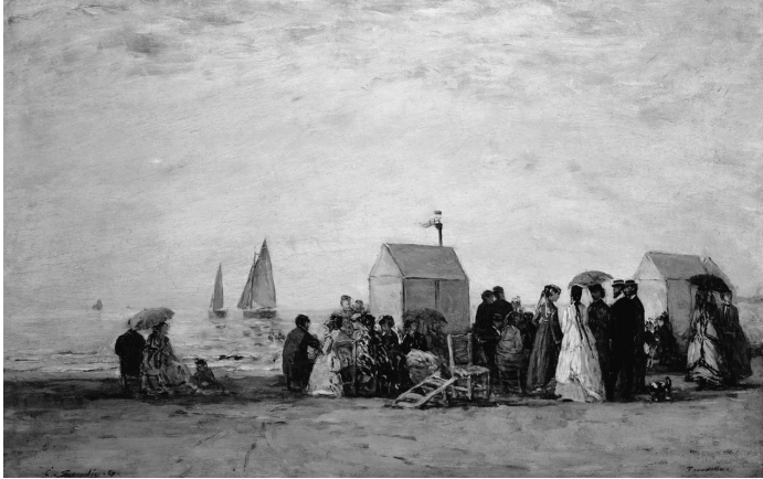
2 Eugène Boudin: Der Strand, 1862, National Gallery, Washington

Dampfschiffe oder modisch gekleidete Strandurlauber (Abb. 2) zeigten, dass es sich hier nicht um arkadische Idealdarstellungen handelte. Boudin war damit einer der ersten Künstler, die – Jahre vor den Impressionisten – das Freizeitverhalten des gehobenen Bürgertums zum Bildthema machten. Er wurde zu Monets Mentor und Freund, dem dieser viel mehr als bloß die Einführung in die technischen Voraussetzungen der Freilichtmalerei verdankte. Boudin war es, der als Erster Monets künstlerisches Talent erkannte und die entscheidenden Grundlagen für dessen Karriere legte. «Boudin machte sich mit unendlicher Güte an meine Ausbildung. Auf Dauer öffneten sich mir die Augen, und ich begann, die Natur wirklich zu begreifen; zugleich lernte ich, sie zu lieben.» Auch die Fokussierung auf ein begrenztes Motivfeld und die Betonung der Lichtstimmung sind für Boudins und Monets Kunst charakteristisch. Darüber hinaus verdankte Monet seinem Freund die entscheidende Erkenntnis, sich keinem Lehrmeister unterzuordnen, sondern sich vor allem auf das eigene Sehen zu verlassen.