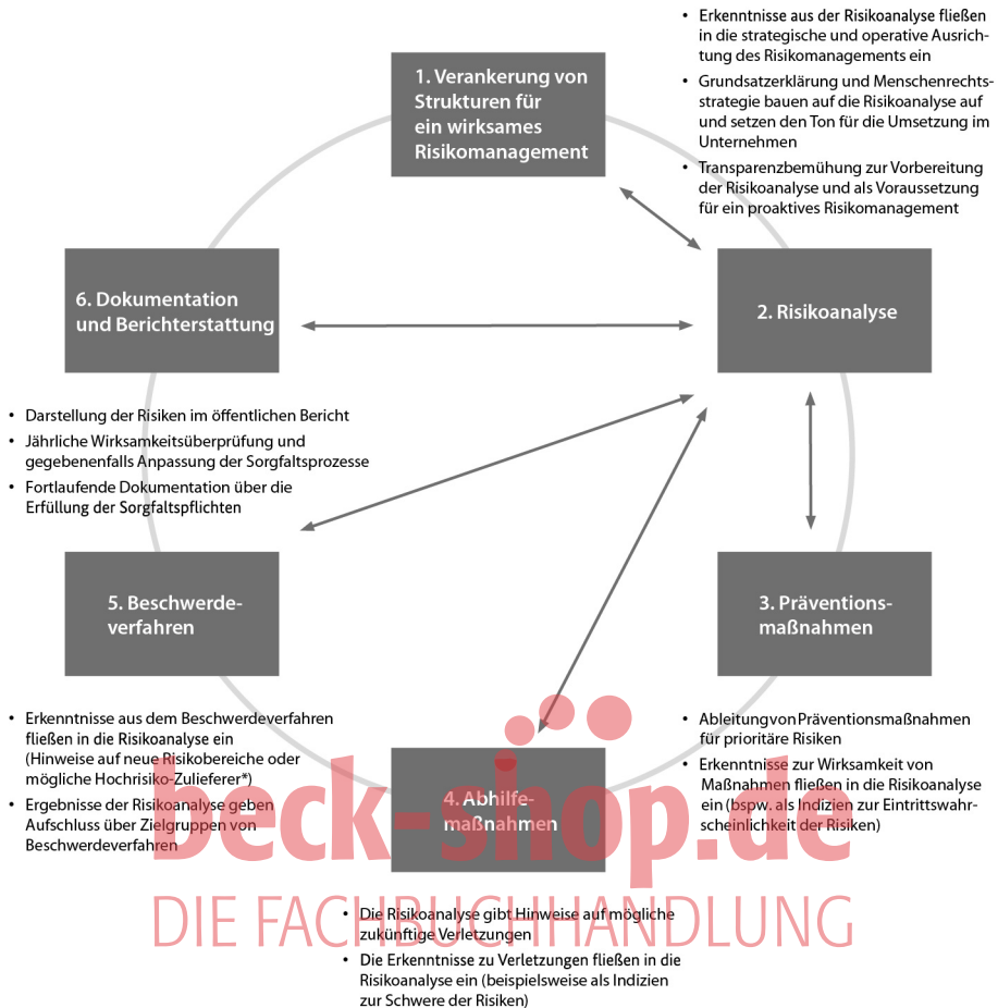
Abb. 17: Zusammenhang zwischen der Risikoanalyse und weiteren Elementen von Sorgfaltsprozessen, Quelle: Bundesamt für Wirtschaft und Ausfuhrkontrolle, Handreichung zur Umsetzung einer Risikoanalyse nach den Vorgaben des Lieferkettensorgfaltpflichtengesetzes, 1. Auf. 2022, S. 5.

Ziel der Maßnahmen ist es, menschenrechtliche und umweltbezogene Risiken zu erkennen und (sodann) zu minimieren sowie Verletzungen menschenrechtsbezogener oder umweltbezogener Pflichten zu verhindern , zu beenden oder deren Ausmaß zu minimieren. Die Verpflichtung ist auf solche Risiken und Verletzungen innerhalb der Lieferkette begrenzt, die das Unternehmen verursacht oder dazu beigetragen hat. 86 Zu berücksichtigende Risikolagen können jedoch auch aus externen Umständen resultieren (zB Verschlechterungen der Sicherheitslage oder sonstige Katastrophen (Dammbrüche, Überflutungen, etc)). 87 Dann liegt der Verursachungsbeitrag ggf. darin, eine Reaktion auf die geänderte Sachlage unterlassen zu haben.