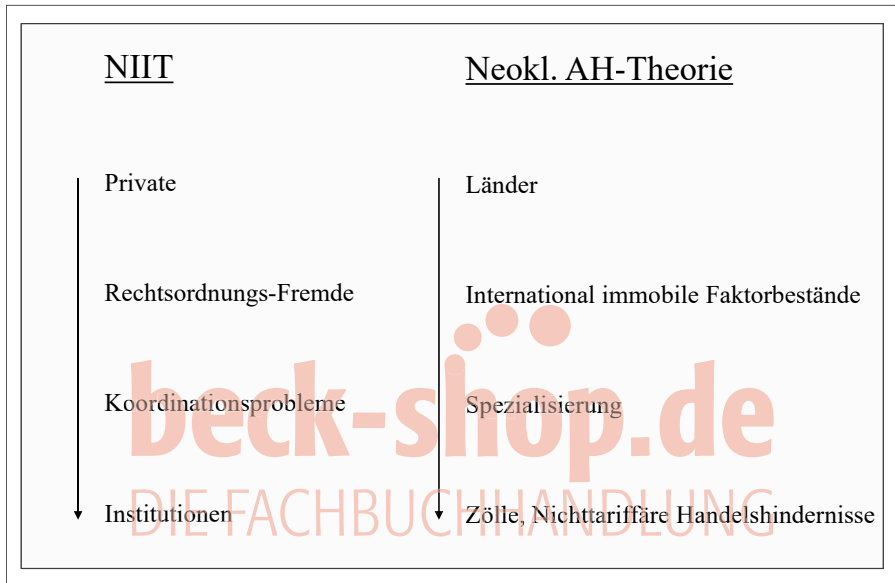
Abb. 53: Unterschiedliche Vorgehensweise und Perspektiven von NIIT und neoklassischer Außenhandelstheorie

Abb. 53 stellt diese unterschiedliche Herangehensweise an außenwirtschaftliche Fragestellungen schematisch dar.