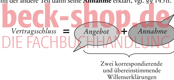
Abbildung 23: Vertragsschluss