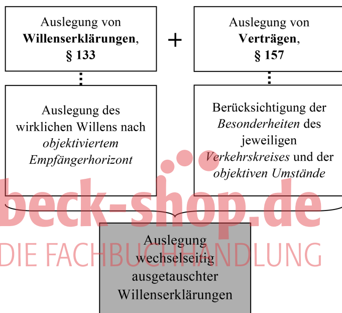
Abbildung 24: Auslegungsregeln

Behauptete gar nicht versprochen zu haben (im Handelsrecht gibt es daher auch die gewohnheitsrechtliche Figur des „kaufmännischen Bestätigungsschreibens“, vgl. § 6 II 3, Rn. 18). Juristen sind dann gefragt, wenn beide Seiten von einem unterschiedlichen Vertragsinhalt ausgehen. Führt diese Differenzen gleich zur Nichtigkeit des Vertrags, wäre der Vertrag kein sehr taugliches Instrument zur Rechtsgestaltung. Jede mit dem Vertragsschluss später unzufriedene Seite würde dann einfach behaupten, etwas ganz anderes gewollt zu haben. Es muss also eine Möglichkeit geben, den für die „rechtliche Beurteilung maßgeblichen Inhalt einer Willenserklärung“ festzustellen (näher juris-PK-BGB/Reichold BGB § 133 Rn. 7ff.). Dies geschieht durch die Auslegung von rechtsgeschäftlichen Erklärungen nach §§ 133, 157.