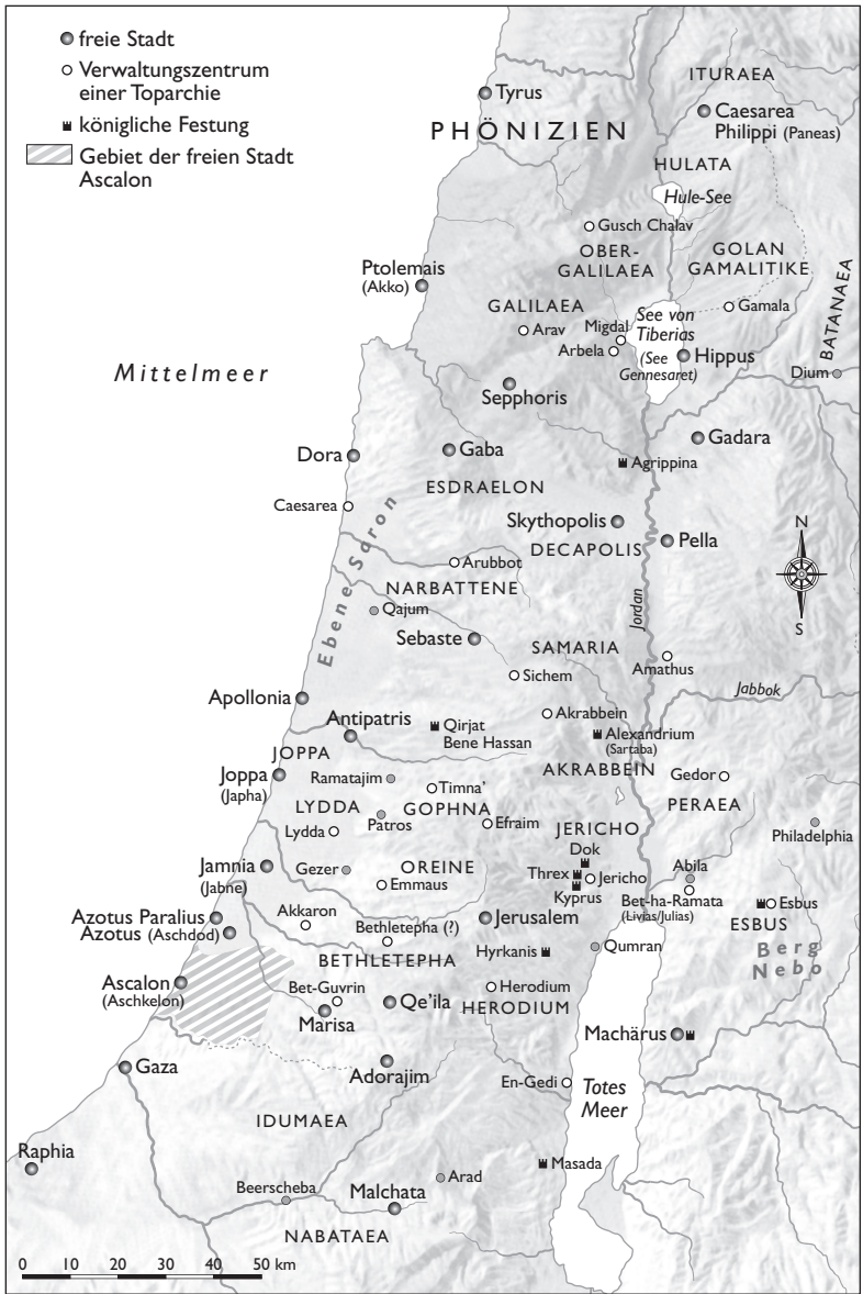
Abb. 1 Der palästinensische Raum zur Zeit des Herodes