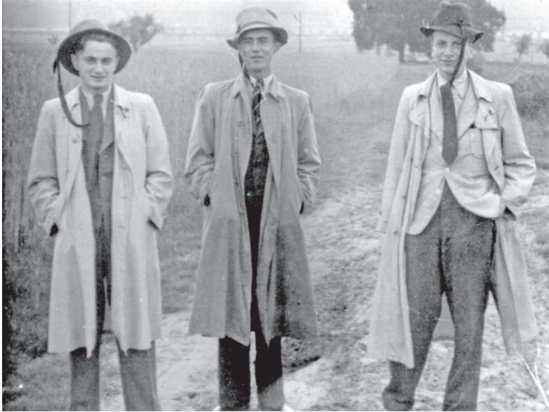
Abb. 6: Jürgen Ponto (rechts) mit Freunden