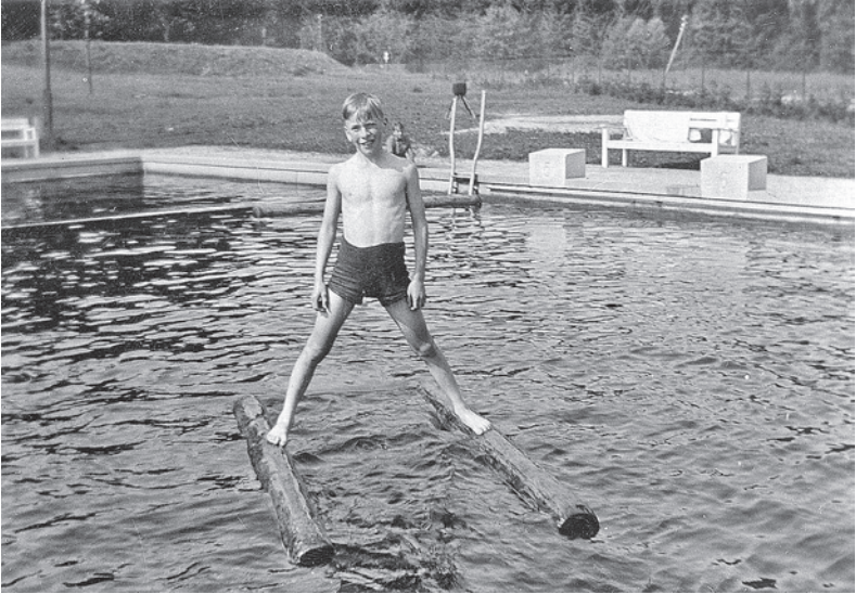
Abb. 4: Jürgen Ponto während eines Sommerurlaubs im Harz, 1934