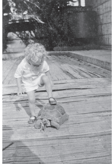
Abb. 3a: Die Familie Ponto in Bahía de Caráquez, Dezember 1925