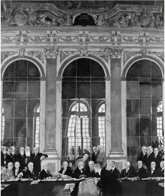
Unterzeichnung des Versailler Vertrags 28.6.1919