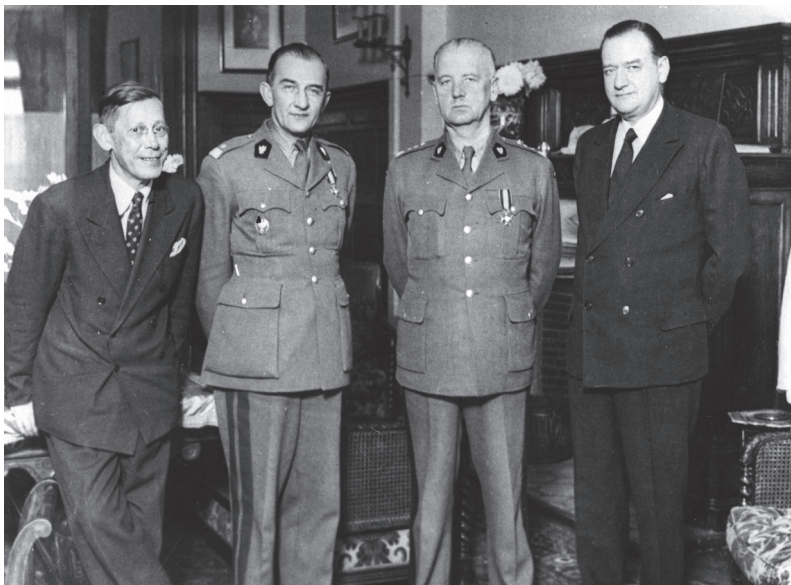
Józef H. Retinger (ganz links), die «graue Eminenz» von General Sikorski (zweiter von rechts)

Mitarbeitern und empfahl, Churchill, der privat ein rechtschaffener und loyaler Mensch, hingebungsvoller Ehemann und guter Vater war, auf persönlicher Ebene zu begegnen. Sikorski und die anderen Regierungsmitglieder sollten versuchen, seine Freundschaft zu gewinnen.» 3 Ob der General, an den diese Empfehlung in erster Linie gerichtet war, in Churchill einen verlässlichen politischen Partner finden würde, habe er ein wenig bezweifelt, schreibt er ferner, dafür aber den Eindruck gehabt, dass er mit seiner persönlichen Sympathie rechnen könne. Er hatte in beiden Punkten recht. Nur sollten die politischen Enttäuschungen noch eine Weile auf sich warten lassen, während eine gute persönliche Verbindung zwischen den beiden Regierungschefs sehr schnell zustande kam. Und diese sowie die Freundschaft mit Retinger sollten Sikorski schon sehr bald unschätzbare Dienste erweisen.