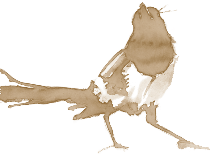
Elster (Pica pica bactriana)