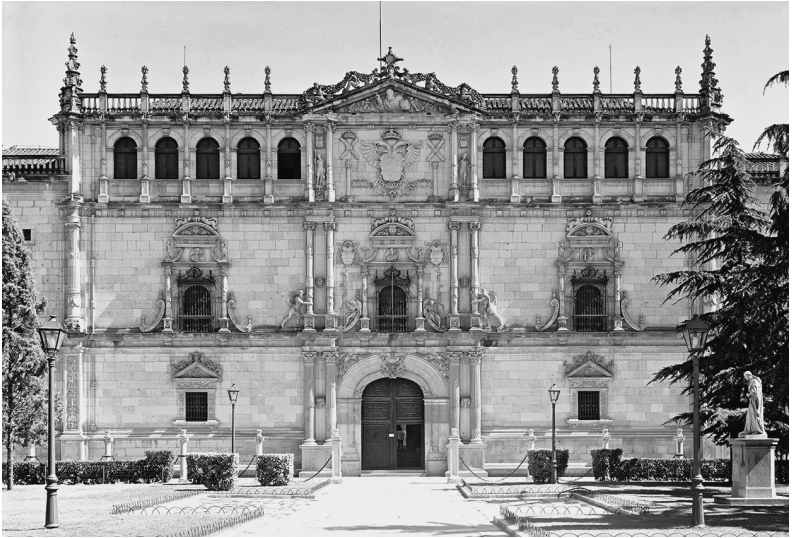
Hauptfassade der Universität von Alcalá de Henares

Don Carlos zum Studium in die Stadt, nicht zuletzt deshalb, weil die Universität von Alcalá im Gegensatz zur eher demokratisch ausgerichteten Universität von Salamanca eine zentralistische Verfassung hatte. Der Rektor wurde vom Erzbischof von Toledo ernannt und vertrat die königliche Autorität.