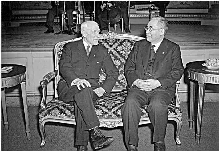
Februar 1941: US-Außenminister Cordell Hull und der japanische Botschafter Nomura Kichisaburō suchen in Gesprächen in Washington nach einer Lösung für den amerikanisch-japanischen Konflikt.

gegangen. Zugleich mussten die Rohstoffe Südostasiens gerade in Anbetracht des verhängten amerikanischen Embargos lukrative Zielobjekte in den Augen der Befürworter einer weiteren Expansion sein – dessen war sich Nomura bewusst.