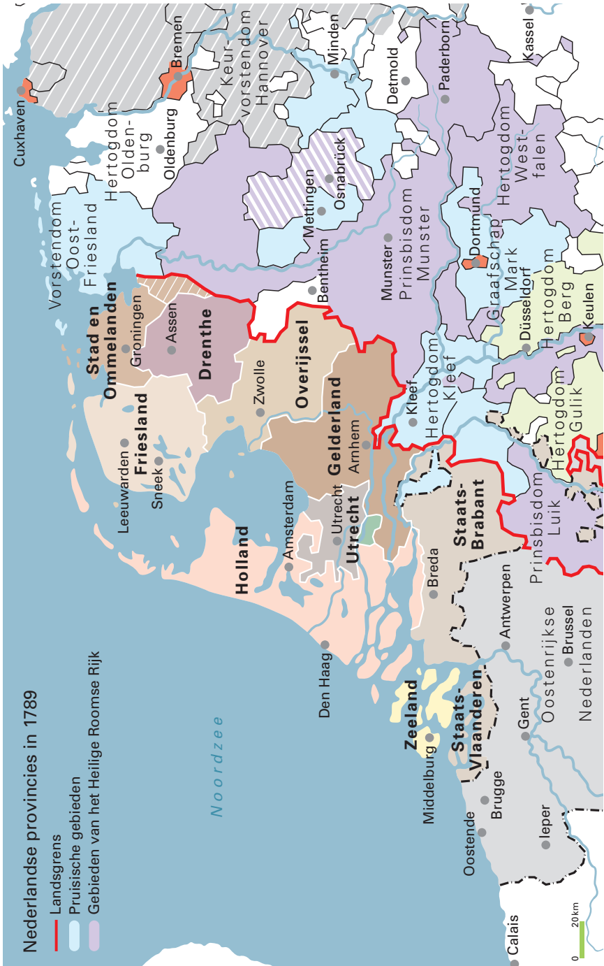
Afbeelding 2.2: De Nederlandse provincies in 1789.