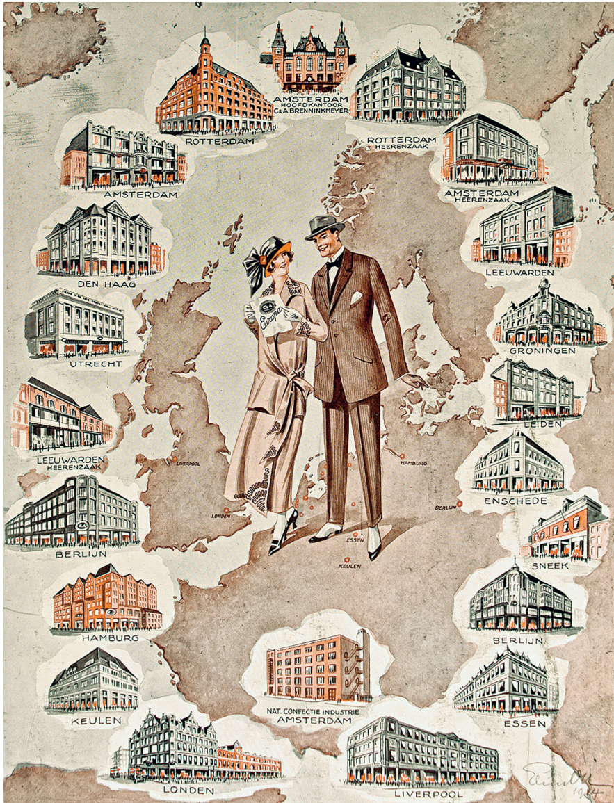
Reclameplaat van C&A Holland uit het voorjaar van 1924