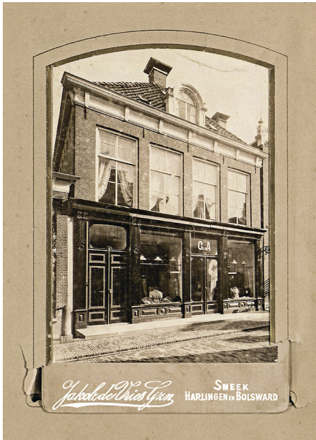
Afbeelding 2.5: Foto van de eerste winkel van C&A Brenninkmeijer in Sneek.