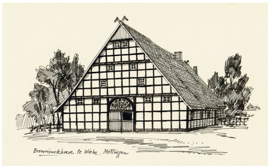
Afbeelding 2.1: De Brenninkhof in Mettingen.

Bron: Tekening Otto Dicke, circa 1972, DCM, Sig. 109283.