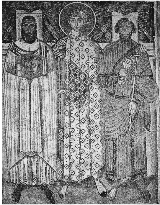
Abb. 1: Der heilige Demetrios mit dem weltlichen und dem kirchlichen Stifter. Thessaloniki, Hagios Dimitrios, 7. Jh.

ckelte sie sich durch Aufnahme zahlreicher griechischer Schriftzeichen zum kyrillischen Alphabet weiter, während in Bosnien eine regionale Variante, die Bosančica, entstand. In Kroatien, Dalmatien und auf den Adriainseln blieb punktuell noch die Urform erhalten. Dort existierten jahrhundertlang lateinische, kyrillische und glagolitische Schriftvarianten nebeneinander, überlagerten und vermischten sich. 64