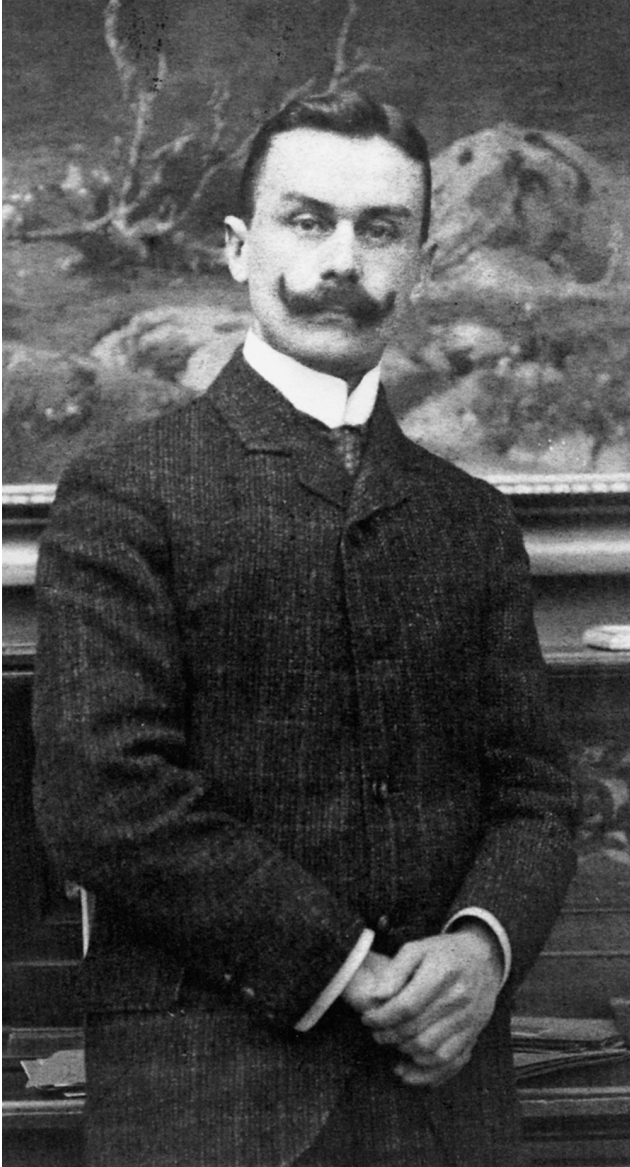
Abb. 1: Der dreißigjährige Thomas Mann (1905)