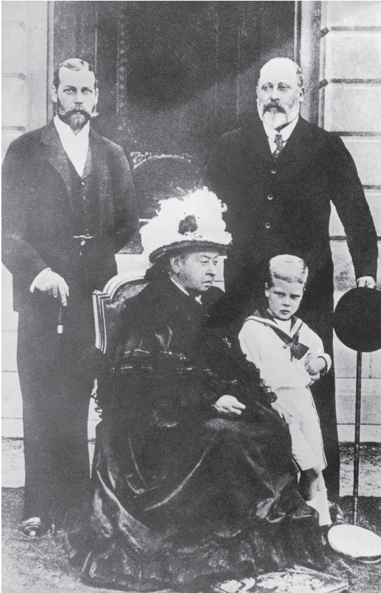
Abb. I: Vier Generationen: Königin Viktoria mit dem Herzog von York (Georg V.), Prinz von Wales (Eduard VII.) und Prinz Eduard von York (Eduard VIII.), um 1900.

Klasse als auch der Bevölkerung des Königreichs in Grenzen, als durch die Heirat der jungen Königin Viktoria mit ihrem deutschen Vetter, dem Prinzen Albert von Sachsen-Coburg und Gotha (1819–1861), am 10. Februar 1840 die britische Dynastie ihren Namen wechselte und damit vor aller Augen sozusagen