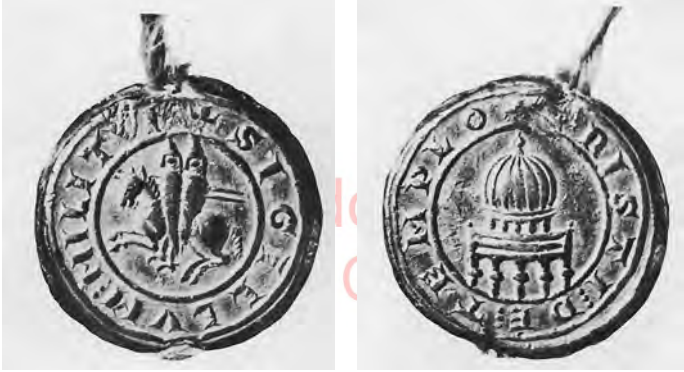
Bleibulle Bertrands de Blanchefort, 1168, Vorder- und Rückseite

Das Ideal des Templerordens – die Verbindung von Mönchtum und «Heidenkampf» – entwickelte eine ungeheuere Anziehungskraft. Nach seinem Vorbild bildete sich ein ganzer Ordenszötus, die Gruppe der geistlichen Ritterorden, die sich am «Lob der neuen Ritterschaft» Bernhards von Clairvaux orientierten. So wurden die als Hospitalgemeinschaft gegründeten Johanniter ebenso nachträglich «militarisiert» wie der 1190 vor Akkon gegründete spätere Deutsche Orden, dem 1198 unter anderem die Templerregel übertragen wurde, und in Spanien wie im Baltikum entstanden Neugründungen nach dem Vorbild der Templer. Alle diese Orden, aber insbesondere die drei großen internationalen Orden der Templer und Johanniter sowie der Deutsche Orden, wurden im 13. Jahrhundert immer stärker in die Verteidigung der verbliebenen Kreuzfahrerterritorien eingebunden. Zwar gerieten sie in eine Krise, als diese nach und nach verloren gingen, am Ende konnten sich die meisten von ihnen jedoch behaupten. Der weitaus verhängnisvollere Schlag traf die Brüder des Templerordens, als sie durch den französischen König Philipp IV. seit 1307 zahlreicher Vergehen und Verbrechen beschuldigt wurden. Das sich lange hinziehende Verfahren endete schließlich in der Aufhebung des Ordens auf dem Konzil von Vienne 1312.