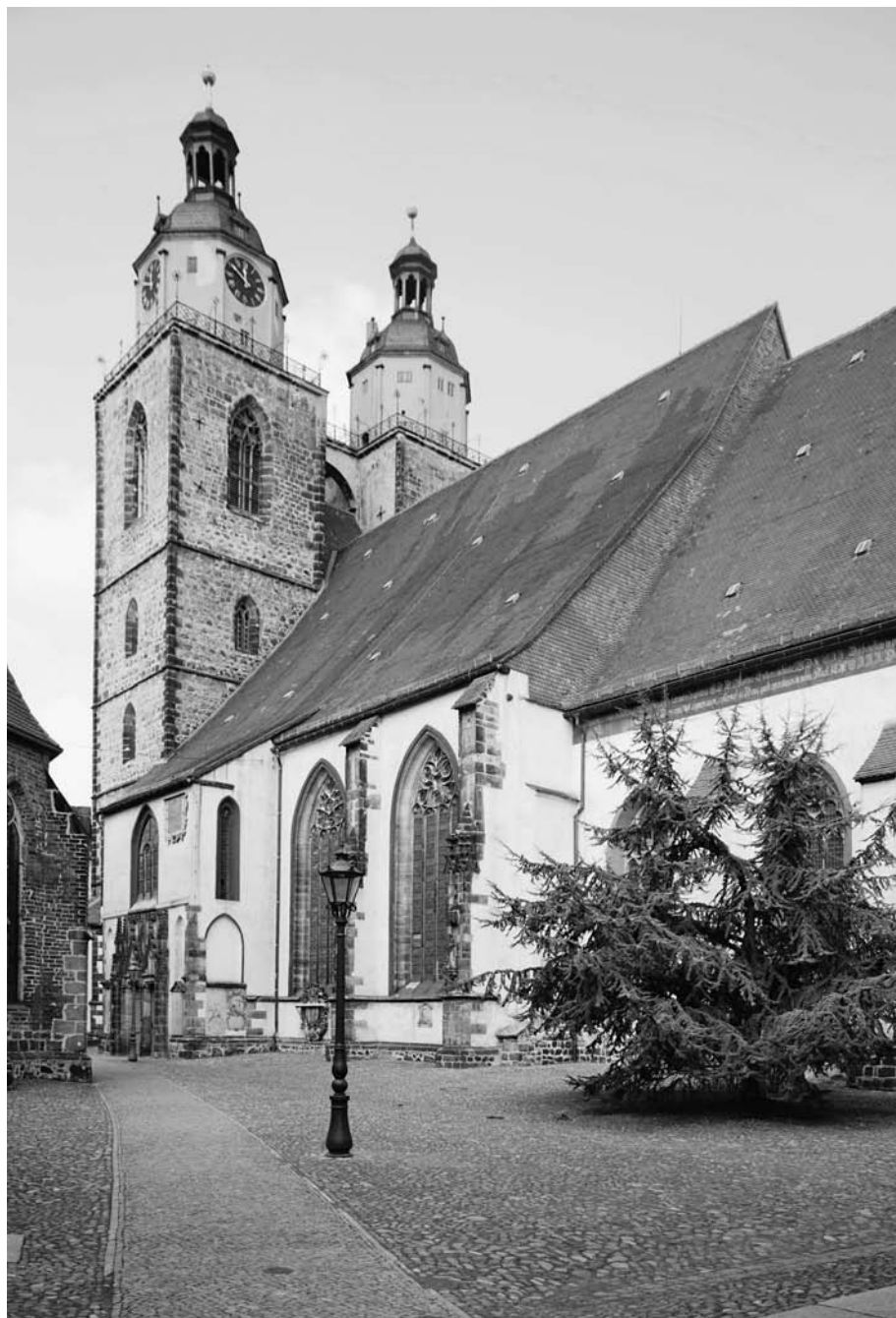
In der Stadtkirche in Wittenberg predigte Martin Luther. Die Kirche gilt als «Mutterkirche der Reformation».