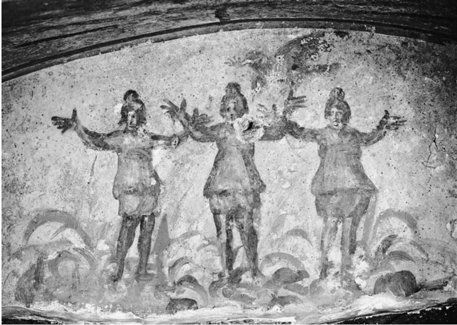
Die Darstellung der drei Jünglinge im Feuerofen in der Priscilla-Katakombe aus dem 3. Jahrhundert.

und kunstgeschichtliche Bedeutung hinaus Zeugen des Glaubens unserer Vorfahren im Glauben. Wir begegnen etwa Jesus Christus in der Orantenhaltung im Gebet mit Gott, seinem Vater, mit dem, durch den und in dem auch wir vertrauensvoll beten sollen «Unser Vater». Wir sehen immer wieder das Zeichen eines Fisches, der den frühen Christen als Erkennungszeichen diente; denn die einzelnen Buchstaben des griechischen Wortes für Fisch, ichtys , war für sie eine Kurzformel ihres Glaubens: Jesus Christus, Sohn Gottes, Heiland. Weiterhin sehen wir Jona, der nach drei Tagen aus dem dunklen Bauch des Fisches ans Licht der Welt zurückkommt und damit ein Bild für Tod und Auferstehung Jesu Christi ist.