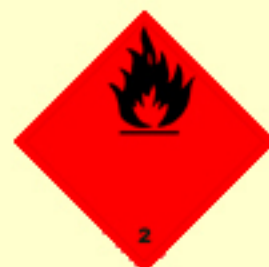
Klasse 2 Entzündbare Gase Nr. 2.1