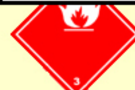
Klasse 3 Entzündbare flüssige Stoffe Nr. 3