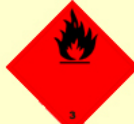
Klasse 3 Entzündbare flüssige Stoffe Nr. 3