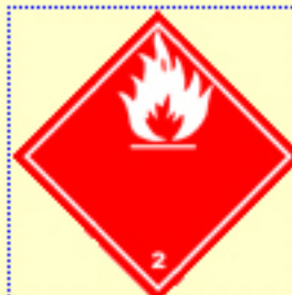
Klasse 2 Entzündbare Gase Nr. 2.1