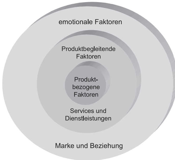
Abb. 69: Differenzierung als Basis der Vertriebskonzeption

Wie auch empirische Untersuchungen (z. B. Jenner [1999]) belegen, gewinnt die Vertriebsstärke als Einflussfaktor auf den Markterfolg eines Unternehmens immer mehr an Bedeutung. Für die Verbesserung des Ratings ist es daher ein zunehmend interessanter werdender Ansatzpunkt, die Vertriebsstärke auszubauen – und dies auch in der Umsatzentwicklung zu belegen. Die folgende Tabelle zeigt Ansatzpunkte für eine Verbesserung der Vertriebsstärke, die zu einer günstigeren Umsatzentwicklung, und damit einer Verbesserung, indirekten, fast sämtlicher Finanzkennzahlen führt.