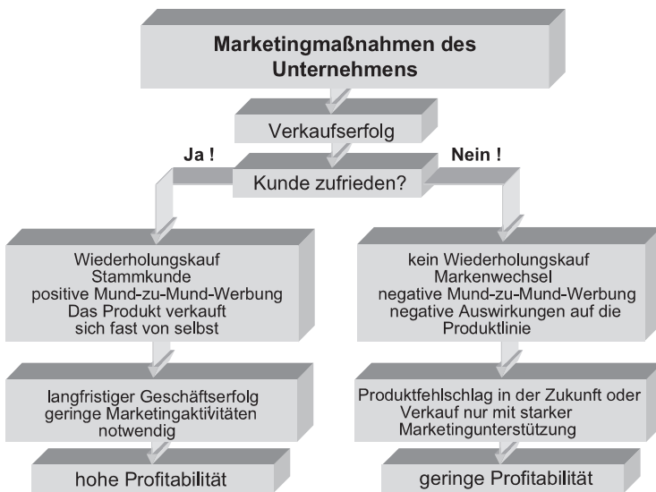
Abb. 72: Marketingmaßnahmen eines Unternehmens

Das Entscheidungsverhalten des Kunden führt zu unterschiedlichen Auswirkungen auf den Geschäftserfolg eines Unternehmens und lässt sich wie folgt grafisch darstellen (in Anlehnung an Simon/Homburg [1998]).