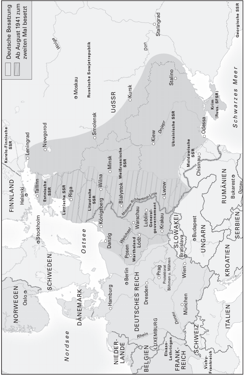
Die Bloodlands im August 1941