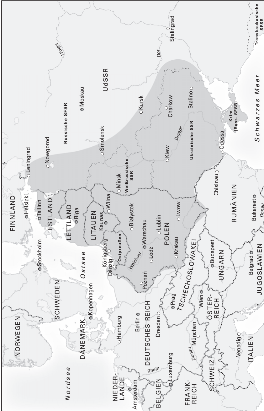
Die Bloodlands um 1933