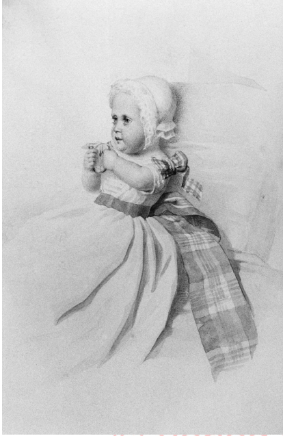
«Thereschen», wie sie lange Zeit in der Familie genannt wird, als Baby

gewählt: väterlicherseits ihre sächsische Großmutter und Namenspatin Therese (1792–1854), die Frau von König Ludwig I. von Bayern (1786–1868), außerdem Thereses Großtante Charlotta Augusta von Österreich (1792–1873), Tochter von Maximilian I. Josef von Bayern und vierte Gemahlin von Kaiser Franz I. von Österreich, sowie von mütterlicher Seite die bereits verstorbene sächsische Großmutter Maria Anna (1799–1832), Großherzogin von Toskana.