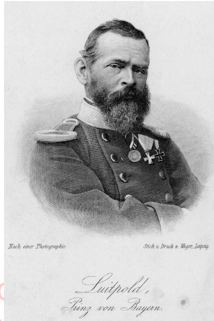
Thereses Vater Luitpold, Prinz von Bayern (1821–1912). Nach einer Photographie, Stich und Druck von Weger, Leipzig

Generationen fortgepflanzt hatte. Nach einigen zögerlichen familiären Verhandlungen kann die Hochzeit zwischen den beiden Fürstenkindern schließlich am 15. April 1844 im Dom von Florenz stattfinden. Sie wird zu einem Ereignis von großem Gepränge: Zahlreich sind die noblen Hochzeitsgäste, zahlreich ist auch das höfische Gefolge aus München. Kein Wunder, dass man zehn sechsspännige Galawagen benötigt, um vom Palazzo Pitti in den Dom zu gelangen. Fünf Tage später folgt dann der feierliche Einzug des frisch vermählten Paares in München, wo schon auf der Sendlinger Straße der höfische Tross vom Volke mit stürmischen «Lebehochs» begrüßt wird. 2