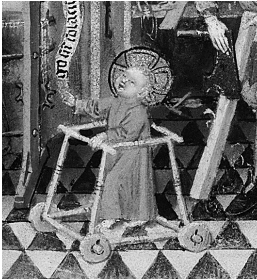
Abb. 3. Kleinkinder beim Spiel (im Laufstall, mit Windrad, mit Steckenpferd) findet man in Darstellungen des Jesusknaben, spielend allein oder mit dem jungen Johannes dem Täufer. Stundenbuch der Katharina von Kleve: die Hl. Familie bei der Arbeit (um 1440), Ausschnitt. New York, Pierpont Morgan Library, ms. 917.