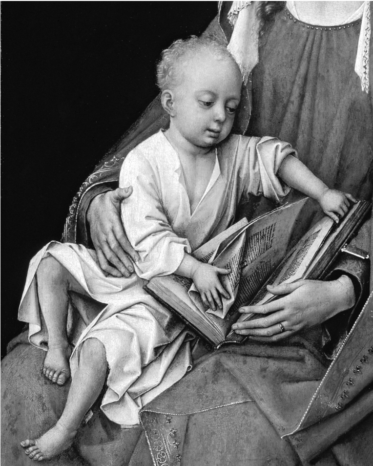
ABB. 2. Kleinkinder begegnen in den traumatischen Erinnerungen von Menschen, die früh auf noch kleinere Kinder hatten Acht geben sollen. Kleinkinder nicht einfach als kleine Erwachsene, sondern bei kindgemäßer Beschäftigung (hier beim Zerblättern eines Buches) finden sich am ehesten bei der Darstellung des Jesusknaben. Rogier van der Weyden, Madonna Durán (um 1435–40), Ausschnitt. Madrid, Prado.