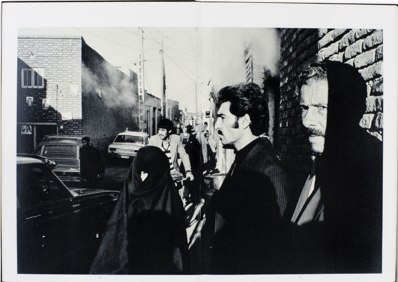
Abb. 4-12 // diese und rechte Seite

In seinem Buch Telex Iran schildert der Fotograf Gilles Peress die Atmosphäre im Iran nach dem Sturz des Schahs 1979. Der Fotograf beschreibt nicht ein konkretes Ereignis oder eine bestimmte Person, sondern übersetzt die Umbruchstimmung in Fotos, die nicht zuerst erklären sollen.