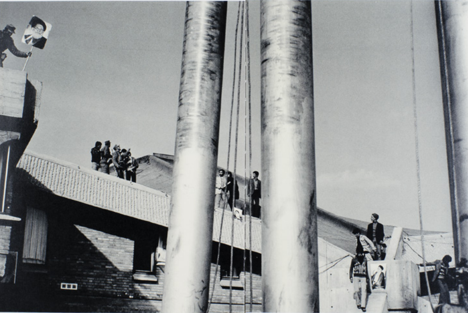
A. MARCH CORRECTLY POSSIBLE CLEAR STONY FOR US SEE AN OFFICER SOLDIERS IN BURNING THE MARCH OF STONY... MORE DETAILS POSSIBLE STONY, B. BEING LEFTING STONY FROM L.A. TO BURNING FOR A WEEK THEN IN BY FOR BURNING C. WHY NOT YOUR PLANS ??? HARRISON