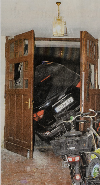
Ungewöhnliches Parkmanöver: 2011 verursachte ein Angestellter der Südkoreanischen Botschaft einen Unfall und flüchtete anschließend zu Fuß.

Auch für andere Straftaten können ausländische Diplomaten nicht verurteilt werden. Vor wenigen Jahren wollte eine indonesische Hausangestellte einen saudi-arabischen Diplomaten verklagen, weil er sie mehr als ein Jahr lang unter sklavensartigen Bedingungen beschäftigt habe. Sie sei geschlagen und gedemütigt worden und habe ihr vereinbartes Gehalt nicht erhalten, behauptete die Frau. Der Mann bestritt die Vorwürfe. Wegen der diplomatischen Immunität konnten die Berliner Gerichte im Jahr 2011 nicht einmal über den Fall verhandeln. Am Ende hatte die Klägerin Glück. Der Mann reiste aus Deutschland aus und verlor dadurch seine Immunität. Daraufhin einigte sich der Diplomat mit der Hausangestellten im März 2013 vor dem Berliner Landesarbeitsgericht, 35.000 Euro Lohn und Schmerzensgeld zu zahlen.