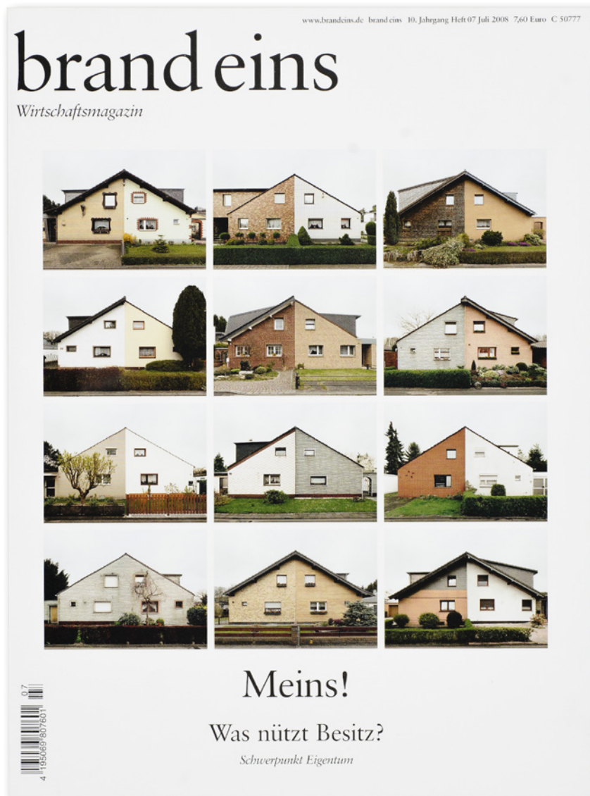
Abb. 4-10 // Eigenheime, fotografiert von Andreas Machanek auf dem Titel von brand eins . Die Bildserie macht die Bauwerke vergleichbar. Gemeinsamkeiten und Unterschiede werden im Nebeneinander deutlich. brand eins , Juli 2008.

Eine Serie ist eine zusammenhängende Gruppe gleichartiger Dinge. Die Bildserie wird, formal anders als die Reportage, aus gleichartig aufgebauten Fotos gebildet. Kennzeichen einer fotografischen Serie ist die formale Ähnlichkeit der in ihr zusammengestellten Fotos. Das vom Fotografen gewählte Thema wird dargestellt durch eine Reihe von Bildern, die in der Auswahl der dargestellten Objekte und im Bildaufbau auf den ersten Blick nahezu identisch sind.