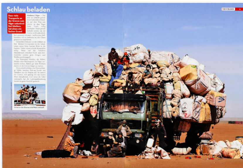
Abb. 4-7 // Das Überladen der LKW ist Teil des Konzepts der Fahrer, um den Weg von Libyen in den Niger möglichst ohne Kontrollen zurücklegen zu können. Die Fahrer hoffen auf die Unlust der Kontrolleure, sich durch die »umfangreiche« Ladung zu arbeiten. Die Geschichte lebt von dem großen Foto (von Dominique Faget/AFP/Getty Images) des kaum noch erkennbaren Fahrzeugs. View , Februar 2015, Seite 10/11.

Immer wieder heben Redaktionen Rubriken in ihre Blätter, in denen »Ein Bild und seine Geschichte« – so meist der Titel dieser wiederkehrenden Beiträge – erzählt werden. Ausschließlich solche Fotos bilden den Inhalt der seit 2005 monatlich erscheinenden Zeitschrift View . Doppelseitige Einzelbilder werden begleitet durch kurze Kästen, mit vertiefenden Informationen. Einzelnen Bildstrecken sind kurze erklärende Texte von maximal einer Spalte Länge angefügt. Grundlage jeder Veröffentlichung ist die Qualität des Bilds. Nur wenn ein Ereignis durch ein hochwertiges Foto dargestellt wird, erfolgt die Veröffentlichung – der manchmal auch eher unwichtigen Geschichte.