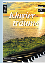
KLAVIERTRÄUME Bezaubernd-romantische Stücke für Klavier A4-Buch inkl. CD, 72 S. ISBN 978-3-86642-085-4