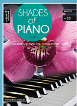
SHADES OF PIANO The romantic song collection for two hands A4-Buch inkl. CD, 48 S. ISBN 978-3-86642-086-1