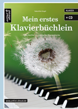
MEIN ERSTES KLAVIERBÜCHLEIN Sehr leichte, romantische Klavierstücke A4-Buch inkl. CD, 48 S. ISBN 978-3-86642-082-3