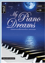
MY PIANO DREAMS Zauberhaft-romantische Klavierträume - leicht arrangiert A4-Buch inkl. CD, 52 S. ISBN 978-3-86642-090-8