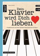
DEIN KLAVIER WIRD DICH LIEBEN 19 gefühlvolle und leicht spielbare Kompositionen für Piano A4-Buch inkl. CD, 46 S. ISBN 978-3-86642-092-2