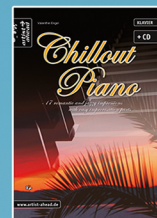
CHILLOUT PIANO 17 romantic and jazzy impressions with easy improvisation parts A4-Buch inkl. CD, 56 S. ISBN 978-3-936807-97-4