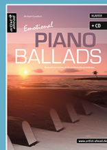
EMOTIONAL PIANO BALLADS Bezaubernd-schöne, leicht spielbare Klavierballaden A4-Buch inkl. CD, 56 S. ISBN 978-3-86642-091-5