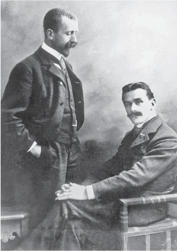
Gerechtigkeit und Ordnung: Heinrich und Thomas Mann im Jahre 1905.

und das Entsetzen einer aufgeklärten Öffentlichkeit in Deutschland erregt hatten.