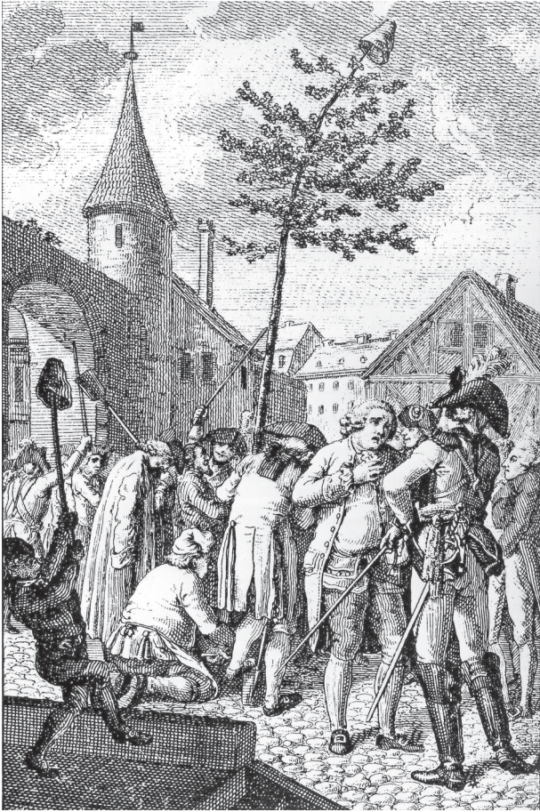
Worms im Frühjahr 1793: Preußische Truppen lassen einen Freiheitsbaum ausgraben.

meister oder Ortsvorsteher im neuen republikanischen Regime gemacht worden war, von den Bauern ausgeplündert, und als er sich im Nachbarort bei der preußischen Besetzung rechtfertigen wollte (er hatte versucht, auch unter französischer Besetzung im Sinne der alten Obrigkeit zu agieren und sich als Vermittler betätigt), wurde er auch da erst einmal mit Stöcken halb tot geschlagen. Laukhard notiert, dass viele der Betroffenen Pfarrer, Amtleute und Wirte waren, also Gebildete und