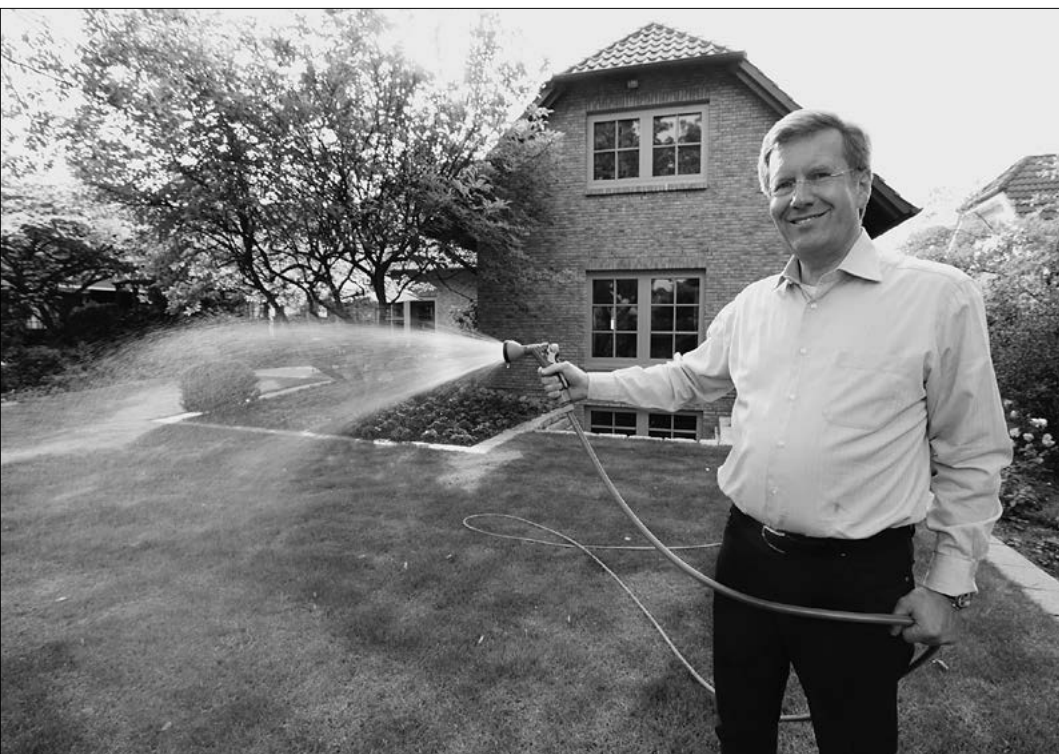
Großburgwedel, Christian Wulff vor seinem Eigenheim