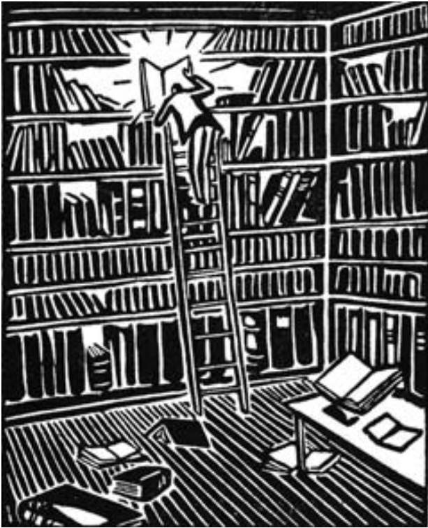
Frans Masereel, Umschlagabbildung von 1927. Ein Almanach für Kunst und Dichtung aus dem Kurt Wolff Verlag