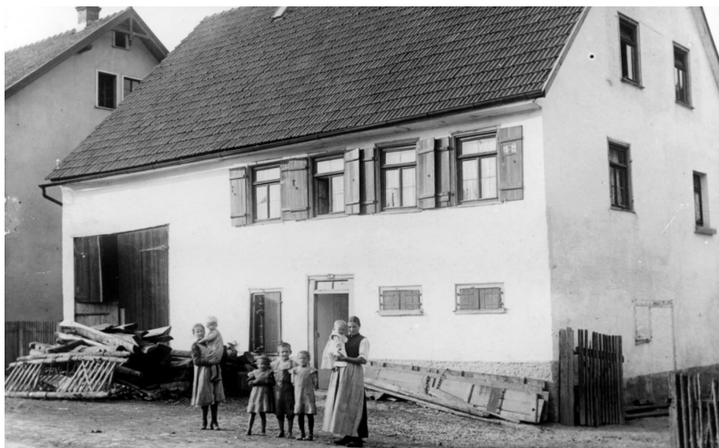
Abb. 2: Die Familie Georg Elsers vor dem Elternhaus in Königsbronn Ende 1910.

Georg Elser wurde am 4. Januar 1903 im schwäbischen Hermaringen geboren und wuchs in schwierige, ärmliche Familienverhältnisse hinein. Seine Mutter stammte aus diesem Dorf auf der östlichen Schwäbischen Alb, der Vater arbeitete dort als Fuhrmann. Schon im Jahr darauf zogen die Eltern, die erst nach seiner Geburt heirateten, mit dem Sohn nach Königsbronn, das am Ursprung der Brenz und ebenfalls im Kreis Heidenheim liegt. Diese Gemeinde, die weniger bäuerlich als industriell geprägt war, wurde die eigentliche Heimat des späteren Widerstandskämpfers.