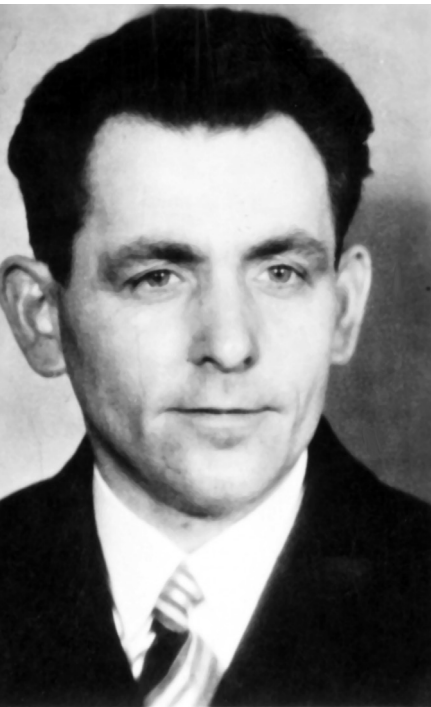
Abb. 1: Georg Elser auf seinem Passfoto um 1938.

kalter Präzision dem Diktator nach dem Leben trachtete und diesem Ziel so nahe kam, wie fünf Jahre später nur noch der Graf Stauffenberg. Lediglich einige Außenseiter zweifeln noch daran, dass er aus ehrenwerten Motiven und unter Berufung auf die allgemeinen Grundrechte handelte, angetrieben von einem ausgeprägten Gefühl für Gerechtigkeit und einer abgründigen Abneigung gegen den Krieg. Dabei leitete diesen Attentäter, der als einfacher Mann und schlichter Handwerker charakterisiert wurde, eine Weitsicht und Hellsicht, die man bei Angehörigen der sogenannten Eliten jener Zeit vergeblich suchte.