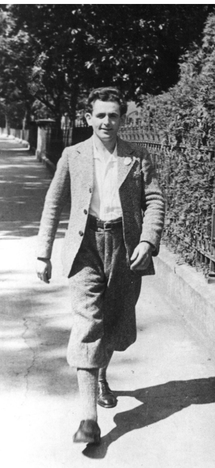
Abb. 4: Georg Elser in Knickerbockern zu Fuß unterwegs Mitte der 1930er Jahre.

Schreiner, der Uhrengehäuse fertigte, wurde einige Male arbeitslos, dann wurde er wieder eingestellt. Im Jahre 1929 schloss die Fabrik nach einem Brand endgültig.