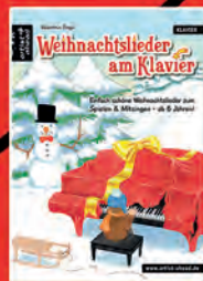
WEIHNACHTSLIEDER AM KLAVIER Einfach schöne Weihnachtslieder zum Spielen & Mitsingen - ab 6 Jahren! ISBN 978-3-86642-074-8