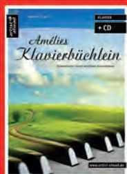
AMÉLIE KLAVIERBÜCHLEIN Romantische, leicht spielbare Klavierstücke ISBN 978-3-86642-043-4