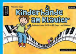
KINDERHÄNDE AM KLAVIER Fröhliche Lieder für 10 bis 20 Finger Ab 3 Jahren! ISBN 978-3-86642-072-4