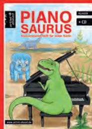
PIANOSAURUS Klavierstücke NUR für wilde Kerle ISBN 978-3-86642-081-6