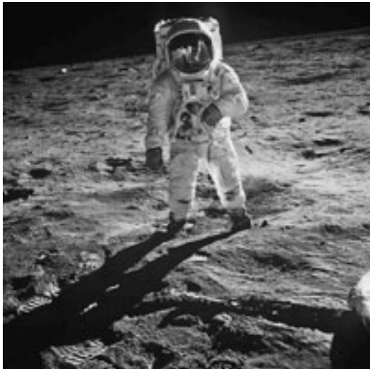
20. Juli 1969. »Buzz« Aldrin auf dem Mond. Ich war zehn und dabei.

Bei Jungen meiner Generation ist damals eine mentale Prägung entstanden, die die Phantasie technisch aufrüstete und die Entdeckungen von Christoph Columbus und die Eroberung des Wilden Westens in Gestalt von Apollo 11 und den Astronauten Armstrong, Aldrin und Collins in der Gegenwart so fortschrieb, dass man selbst ein Teil dieser unablässigen Erweiterung des Machbarkeits- und Erwartungs-