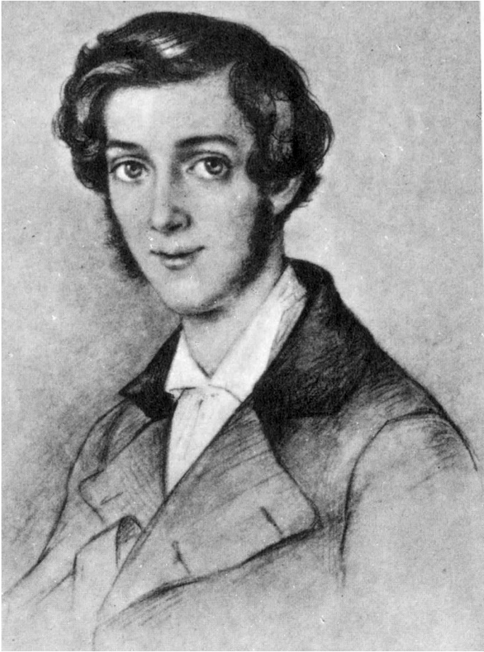
Theodor Fontane 1843 Zeichnung von Friedrich Georg Kersting