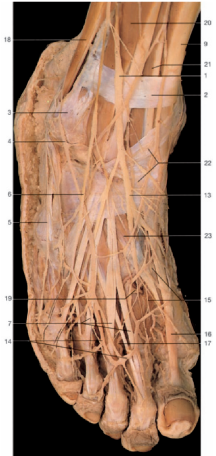
Dorsum of the right foot, superficial layer. The fascia of the dorsum has been removed.