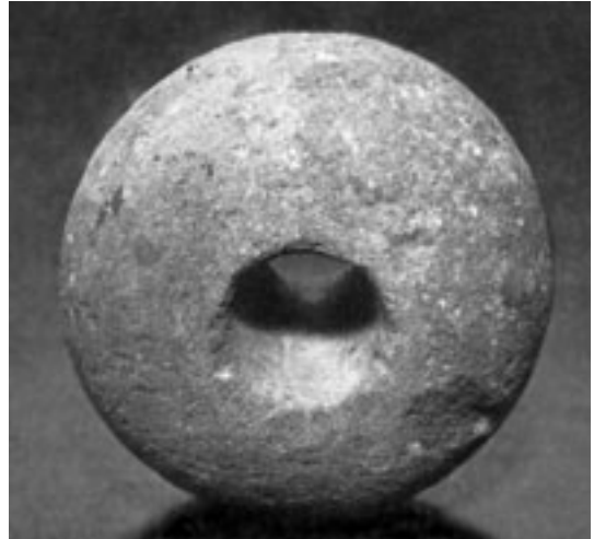
Abb. 1: Durchbohrte Steine wie dieser dienten den Wildbeuterinnen Ostafrikas als Gewichte für Grabstöcke. Sie gruben damit die wilden Knollen aus, von denen sie sich ernährten.

viel später diente das Schleifen auch zur Herstellung von Gewichten für Grabstöcke oder – im Neolithikum – von Äxten und Hacken.)