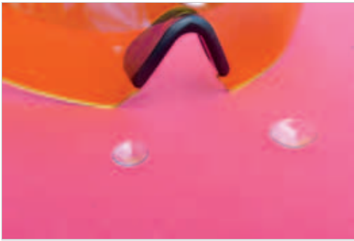
Abb. 4.26 Schutz- und Korrekturmöglichkeiten bei Augenproblemen. Schutzbrille, formstabile, harte Kontaktlinse (links) und weiche Kontaktlinse (rechts).