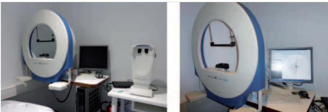
Abb. 4.28 Gesichtsfeldmessung. Messung des Gesichtsfeldes und Binoptometer zum Screening.

Entfernungen kann man sowohl einäugig als auch beidäugig abschätzen. Besitzt man ein normales Stereosehen („3D-Sehen“), das durch horizontale Bildverschiebung (Querdisparation) beider Augen