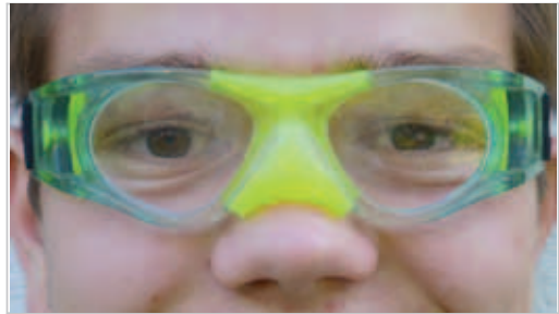
Abb. 4.27 Schutzbrille. Gut angepasste Schutzbrille, z. B. zur Vermeidung weiterer Schäden.