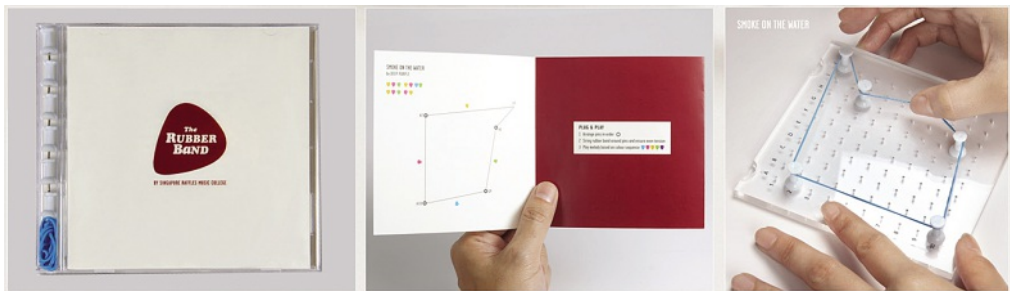
Abb. 3: Die Botschaft: Musik spielen ist einfach und macht Spaß.

lebten mit ihren eigenen Händen, wie einfach und vergnüglich es ist, am Singapore Raffles Music College ein Instrument spielen zu lernen. Der Talent-Selbsttest kam an: Das musikalische Gummiband generierte eine 43-prozentige Rücklaufquote des Mailings und versechsfachte die Nachfragen für den Anfängerkurs — innerhalb von fünf Tagen war er ausgebucht. Es war das erfolgreichste Direktmailing in der Geschichte des Raffles Music College und entstaubte nebenbei noch dessen Image. Wieso begeisterte das Direktmailing so viele Musikstudenten für das Raffles Music College, obwohl das Angebot der Musikschule unverändert blieb?