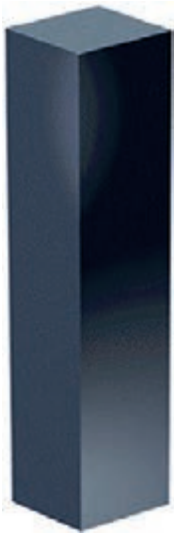
Bild 2 Fahrtschacht eines Seil-aufzuges ohne Triebwerksraum (schematische Darstellung)

den Kundenwünschen ab. Oft ist dieser Einbauort in der obersten Etage eines Gebäudes anzutreffen. Obwohl die Steuerung meist sehr versteckt ist, muss kein Hinweisschild vorhanden sein. Der Zugang zur Steuerung ist so gestaltet, dass unberechtigte Dritte keinen Zugang haben. Meistens sind Schließzylinder vorhanden, deren Schlüssel in der Regel der Betreiber und/oder die zuständige Wartungsfirma der Aufzugsanlage vorhält. Bestenfalls ist die Klappe zur Steuerung mit einem genormten Dreikantverschluss gesichert.