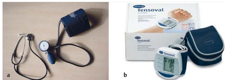
Abb. 11.2 Blutdruckmessgeräte.

► Automatische elektronische Blutdruckmessgeräte. Sie werden wie eine Uhr am Handgelenk oder auch am Oberarm befestigt und zeigen die Werte digital an. Sie sind besonders geeignet, wenn Erkrankte regelmäßig den Blutdruck selbst kontrollieren sollen und werden v. a. in der häuslichen Pflege verwendet. Hier wird der Blutdruck oszillometrisch gemessen, und der Messende muss nach Anlegen der Manschette nur den Messvorgang starten (► Abb. 11.2b).