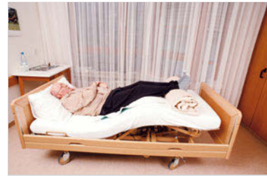
Abb. 11.6 Schocklagerung. Lagerung bei Blutdruckabfall.

Ausnahme. Bei Überlastung des Herzens, wie Herzinsuffizienz, Herzinfarkt, wird eine Herzlagerung vorgenommen. Treten Schocksymptome auf, wie kalter Schweiß, Zyanose, Anstieg der Pulsfrequenz über den systolischen RR-Wert, muss der Notarzt gerufen werden, siehe „Erste Hilfe bei Herz-Kreislauf-Notfällen“ (S. 837).