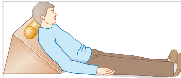
Abb. 11.5 Herzlagerung. Lagerung bei hypertensiver Krise bzw. hypertensivem Notfall.

Bei der hypertensiven Krise soll der Blutdruck nicht stark oder schnell gesenkt werden, es reicht die orale Gabe eines blutdrucksenkenden Medikaments. Arzt benachrichtigen und weiteres Vorgehen absprechen. Wichtig ist, den Betroffenen zu beruhigen, eine Herzlagerung zur Entlastung des Herzens durchzuführen (Oberkörper hoch lagern wie in