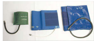
Abb. 11.3 Blutdruckmanschetten. Die Manschette wird entsprechend dem Umfang des Oberarms gewählt, um falsche Werte zu vermeiden.

► Manschettenwahl. Bei einem Oberarmumfang bis 32 Zentimeter kann eine normale Manschette (13 Zentimeter breit, 24 Zentimeter lang) verwendet werden. Bei dickerem Oberarm ist eine längere und breitere Manschette (15 x 30 Zentimeter oder 18 x 36 Zentimeter) erforderlich, da sonst falsch zu hohe Werte gemessen werden. Bei einem Armumfang unter 22 Zentimeter sollte entsprechend eine kleinere Manschette verwendet werden,