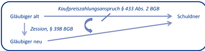
Abb. 31: Übersicht Vorgänge bei der Forderungsabtretung

Der zur Abtretung notwendige Vertrag besteht aus einer formlosen Einigung zwischen Altgläubiger und Neugläubiger über den Forderungsübergang. Eine Mitwirkung des Schuldners ist nicht erforderlich , er muss noch nicht einmal informiert werden (sog. „stille Zession“). Die Forderung muss ebenfalls bestimmt , wenigstens hinsichtlich Person des Schuldners, Inhalt und Höhe bestimmbar sein. Die Abtretung ist nur wirksam, wenn die abgetretene Forderung tatsächlich besteht , ein gutgläubiger Erwerb von Forderungen ist – mangels Besitzes – nicht möglich . Schließlich darf die Abtretung nicht durch ein mit dem Schuldner vereinbartes Abtretungsverbot oder kraft gesetzlichen Verbots ausgeschlossen sein, vgl. §§ 400 BGB, 354a Abs. 1 Satz 1 HGB.