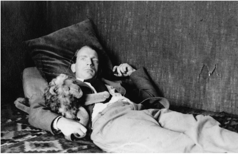
Der Großstadt überdrüssig

delnden Berlin nicht mehr wohl. Der Kulturbetrieb in der Hauptstadt gab ihm ebenso wenig wie das gesellschaftliche und politische Leben, das um 1930 aus den Fugen zu geraten begann. «Es war die zerbröckelnde Umwelt, sagen wir: der falsche Glanz bei so viel Elend-Arbeitslosigkeit, das sogenannte «Establishment» in Deutschland, das mich schockierte und anwiderte. Ich war die junge Generation und wollte die Freiheit.» 10