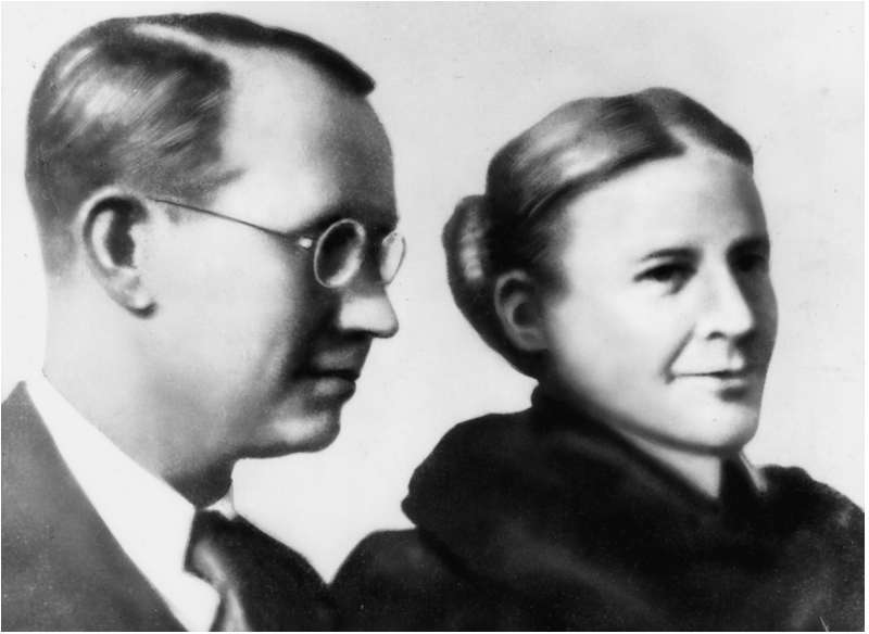
Arvid Harnack mit seiner Frau Mildred

seinen Augen keine Antwort auf die Probleme der Zeit, der Nationalsozialismus und Hitler blieben ebenfalls alles schuldig. Harnacks Hoffnung richtete sich deshalb auf die Sowjetunion; namentlich die sozialistische Wirtschaftsordnung schien die Aussicht auf eine bessere und gerechtere Welt ohne Krisen zu eröffnen. Harnack fuhr selbst in die Sowjetunion, studierte vor Ort die Verhältnisse und verwandelte sich dabei von einem Sympathisanten in einen Genossen in spe, der sich seinen neuen Brüdern und Schwestern im Osten um so näher fühlte, je größer die Gefahr für den Frieden in Europa wurde, die von Hitler ausging. Um diese Gefahr zu bannen, setzte er sich über seine amerikanische Frau 27 auch mit den Westmächten in Verbindung, die er, wie die Sowjets, zu erhöhter Wachsamkeit aufrufen wollte. In Washington und London nahm man seine Warnungen allerdings nicht wirklich ernst, und in den westlichen Hauptstädten zeigte man auch wenig Interesse an den Informationen aus wichtigen Schaltzentralen des Dritten Reiches, zu denen er Zugang hatte.