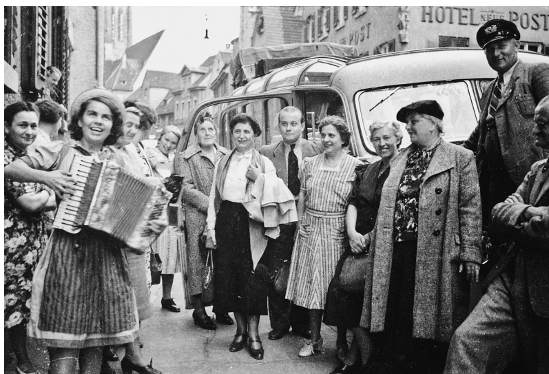
Joy mit ihrer «Zieh»