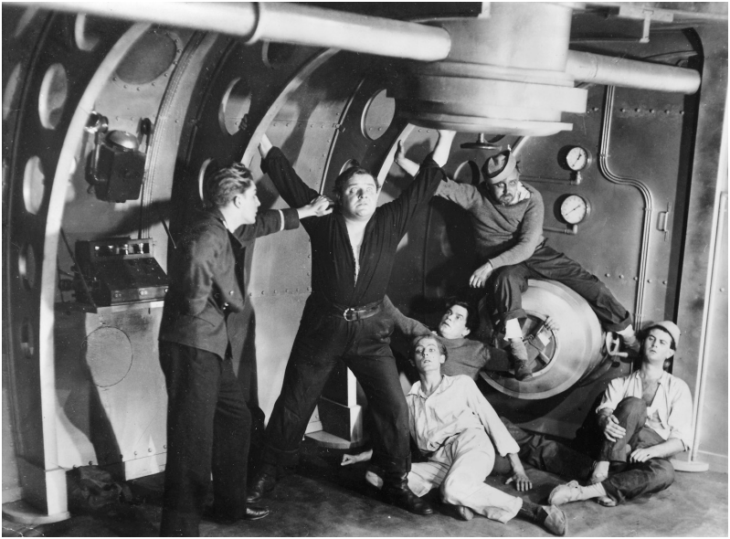
Heinrich George im U-Boot S4

mit der Promotion abgeschlossen hätte. Die Doktorarbeit über «Das Zwei-Helden-Drama als Strukturtyp in der deutschen Dramatik» lag – trotz zahlreicher Engagements bei Bühnen und Zeitungen und ständiger Experimente mit Dramen und Romanen – fertig vor. Es fehlte nur noch die mündliche Prüfung, die Weisenborn aber sausen ließ, weil er eine sensationelle Nachricht erhalten hatte: Kein Geringerer als Erwin Piscator, einer der einflussreichsten Avantgardisten der Weimarer Theaterszene, hatte sein Antikriegsstück «U-Boot S4» zur Aufführung angenommen. 9