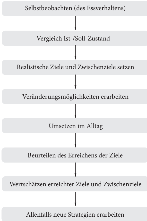
Abbildung 2 Das grundlegende Ablaufmuster verhaltenstherapeutischer Strategien

selbst wertzuschätzen und sich für Anstrengung etwas Gutes zu tun, entfaltet seine Wirkung häufig nicht von Anfang an, sondern erst im Verlauf.