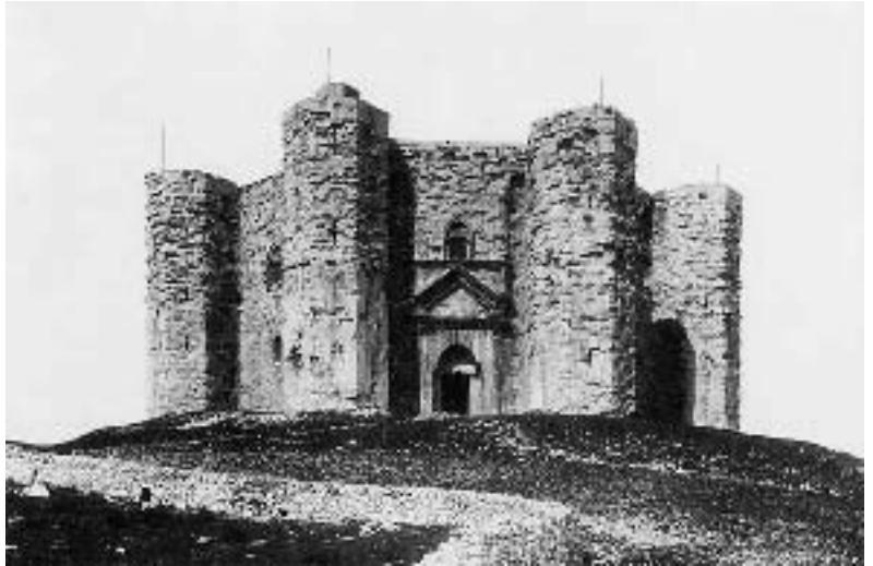
Castel del Monte, Jagdschloss des Hohenstaufenkaisers Friedrichs II. in Apulien