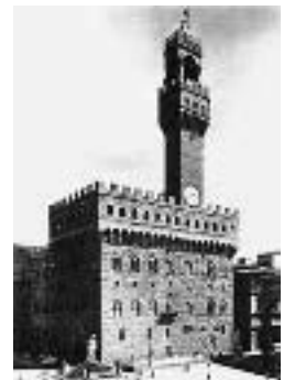
Palazzo Vecchio und Piazza della Signoria in Florenz; Zentrum der kommunalen Macht