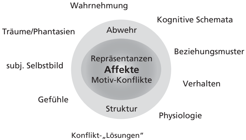
Abb. 2: Affekte und Repräsentanzen als Kern der Persönlichkeit (aus Benecke 2014, S. 233)