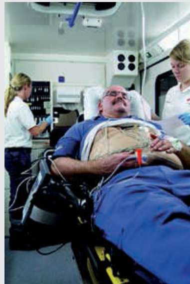
Abb. 1.4