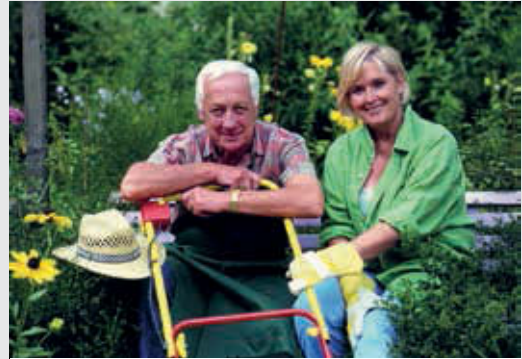
Abb. 1.1

An einem frühen Mittwochabend werden Sie und Ihr Kollege in eine Kleingartenanlage alarmiert. Die ersten warmen Tage waren schon und es ist schön anzusehen, wie schnell die Gärten grün geworden sind. Während der Anfahrt ruft Sie die Leitstelle: „Rotkreuz Beispielstadt 2/83-1 von Leitstelle Beispielstadt, kommen.“ Ihr Kollege antwortet: „Hier 2/83-1, kommen.“ „An der Kleingartenanlage Helvetia müssen Sie von außen an die Gartenparzelle anfahren, Sie werden eingewiesen. Kommen.“ „Hier 2/83-1, verstanden. Ende.“