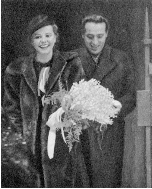
Hochzeit der Eltern 1939, Foto aus der «Filmwelt»

lie kursierte der Spruch: «Hätte der Graf doch nur auf Theodor gehört!»