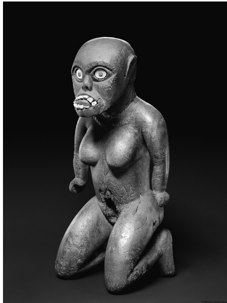
Kihawahine. Staatliche Museen zu Berlin, Ethnolo- gisches Museum.