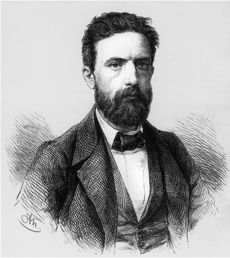
Bastian als junger Mann. Illustrirte Zeitung (1860).