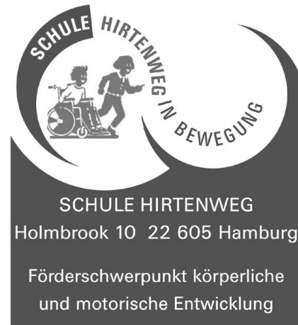
Abb. 3: Schule Hirtenweg, Claim: Schule Hirtenweg in Bewegung