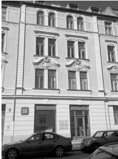
Abb. 4: Das Wohnhaus der Familie Einstein in der Adlzreiterstraße 14 in München.

del in die nördliche Richtung dreht, faszinierte den Jungen. Dieses geheimnisvolle Phänomen wollte er verstehen.