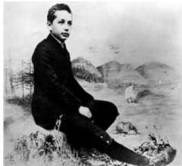
Abb. 5: Albert Einstein im Alter von 14 Jahren.