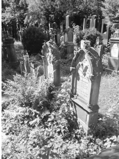
Abb. 1: Grabsteine im jüdischen Friedhof von Buchau.

99 aus der Familie sind hier begraben. Auch der zweite Bürgermeister nach 1946, Siegbert Einstein, ein Großneffe Albert Einsteins, ist hier bestattet.