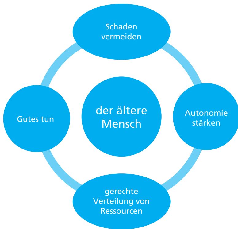
Abb. 2: Eckpunkte für die ethische Fallanalyse

Ältere Menschen, die sich aufgrund kognitiver Einschränkungen selbst schaden könnten, führen vor Augen, dass Gutes tun nur mit »ihrem Einverständnis« erfolgen kann, denn wird dieses von Pflegenden übergangen, kann eine ablehnende Reaktion im Sinne von Verhaltensauffälligkeiten erfolgen. Das übergangene einholen des Einverständnisses kann durch Verhaltensauffälligkeiten nonverbal kommuniziert werden. Die Möglichkeit Gutes zu tun ergibt sich erst nach dem Aufbau einer gelungenen Beziehung, in der der ältere Mensch eine Bestätigung seiner wiederhergestellten Autonomie erhält, die ihm ein Gefühl des Person-seins und seiner Würde gibt.