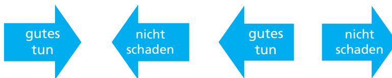
Abb. 5: Gegenüberstellung der einzelnen Themenfelder zur Darstellung von ethischen Fragestellungen

eines Einzelfalls beides zutreffen kann. Eine angedachte pflegerische Intervention kann Gutes bewirken, z. B. die Sturzprävention kann vor einem Schaden, nämlich von gravierenden Sturzfolgen, bewahren. Dies führt zu einer geklärten Situation und damit einer sorgfältigen pflegerischen Versorgung.