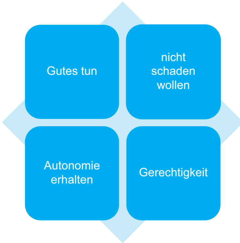
Abb. 4: Sortierung der Informationen und Finden einer Überschrift

sie sortiert werden. Dabei werden die erfassten Informationen in einem ersten Schritt so sortiert, dass sie inhaltlich einem bestimmten Eckpunkt der ethischen Fallanalyse zugeordnet werden können. So entstehen die Themenfelder Gutes tun, nicht schaden, Autonomie und Gerechtigkeit, die unterschiedlich umfangreich ausfallen können. Alle Informationen werden in ein Themenfeld aufgenommen, auch dann, wenn ggf. nur eine einzige Information vorhanden ist (► Abb. 4). Dieses Vorgehen soll sicherstellen, dass keine Informationen verloren gehen.